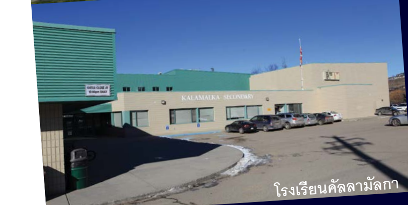
โรงเรียนคัลลามัลกา

โรงเรียนมาสัมผัสกับประสบการณ์เตรียม- ได้รับผลประโยชน์