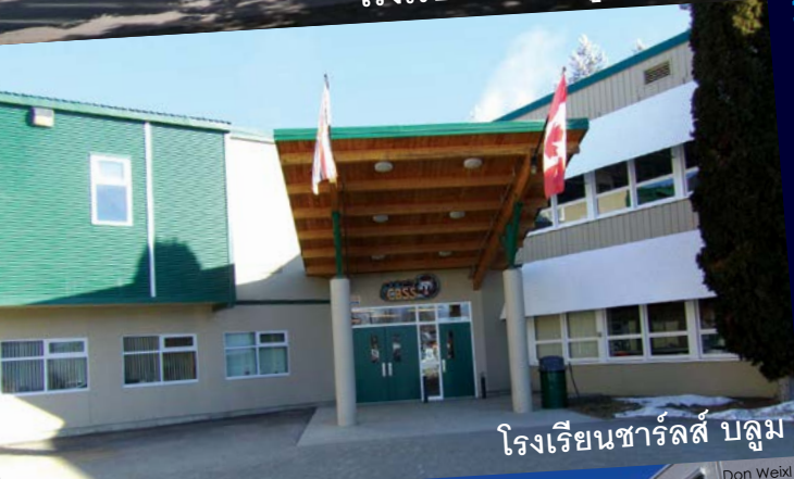
โรงเรียนชาร์ลส์ บลูม