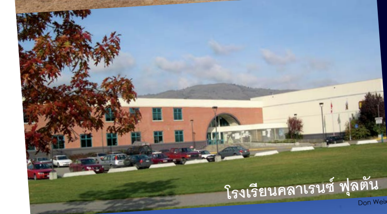
โรงเรียนคลาเรนซ์ ฟูลตัน