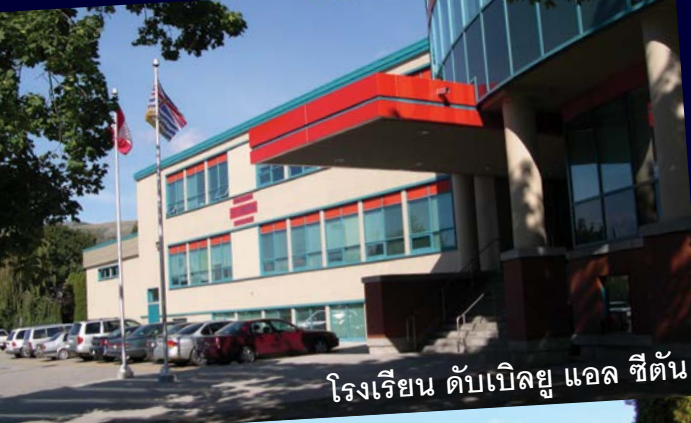
โรงเรียน ดับเบิลยู แอล ซีตัน