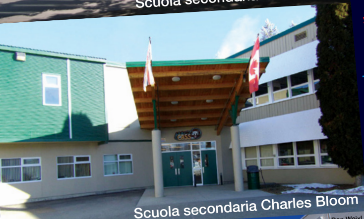
Scuola secondaria Charles Bloom