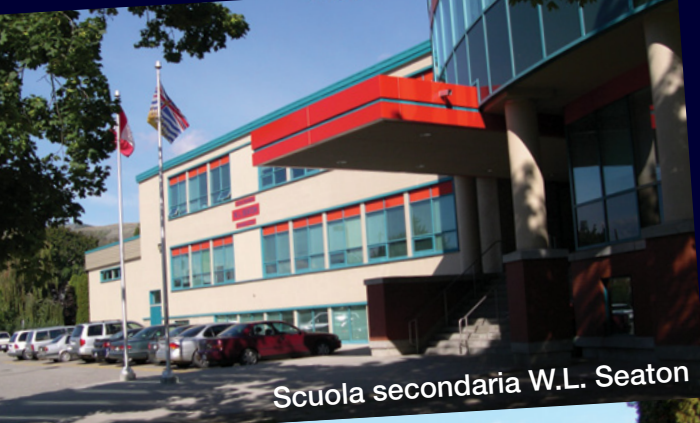
Scuola secondaria W.L. Seaton