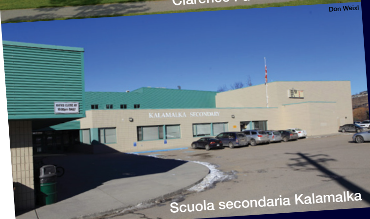
Scuola secondaria Kalamalka

Imparare Sperimentare Preparare Beneficiare