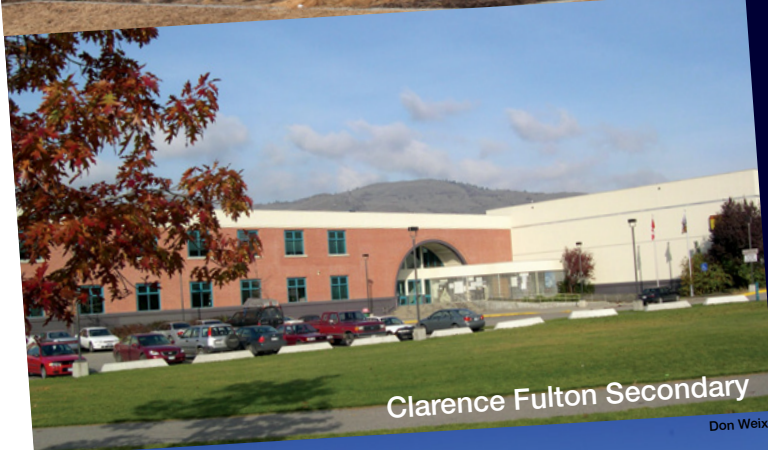
Clarence Fulton Secondary